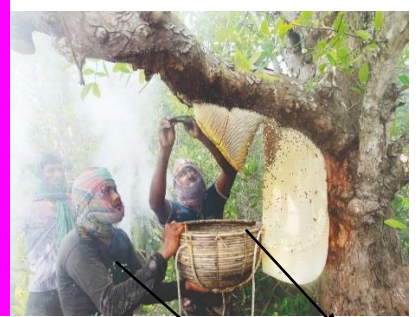
মৌয়াল ঝুড়িতে মধু নিচ্ছে