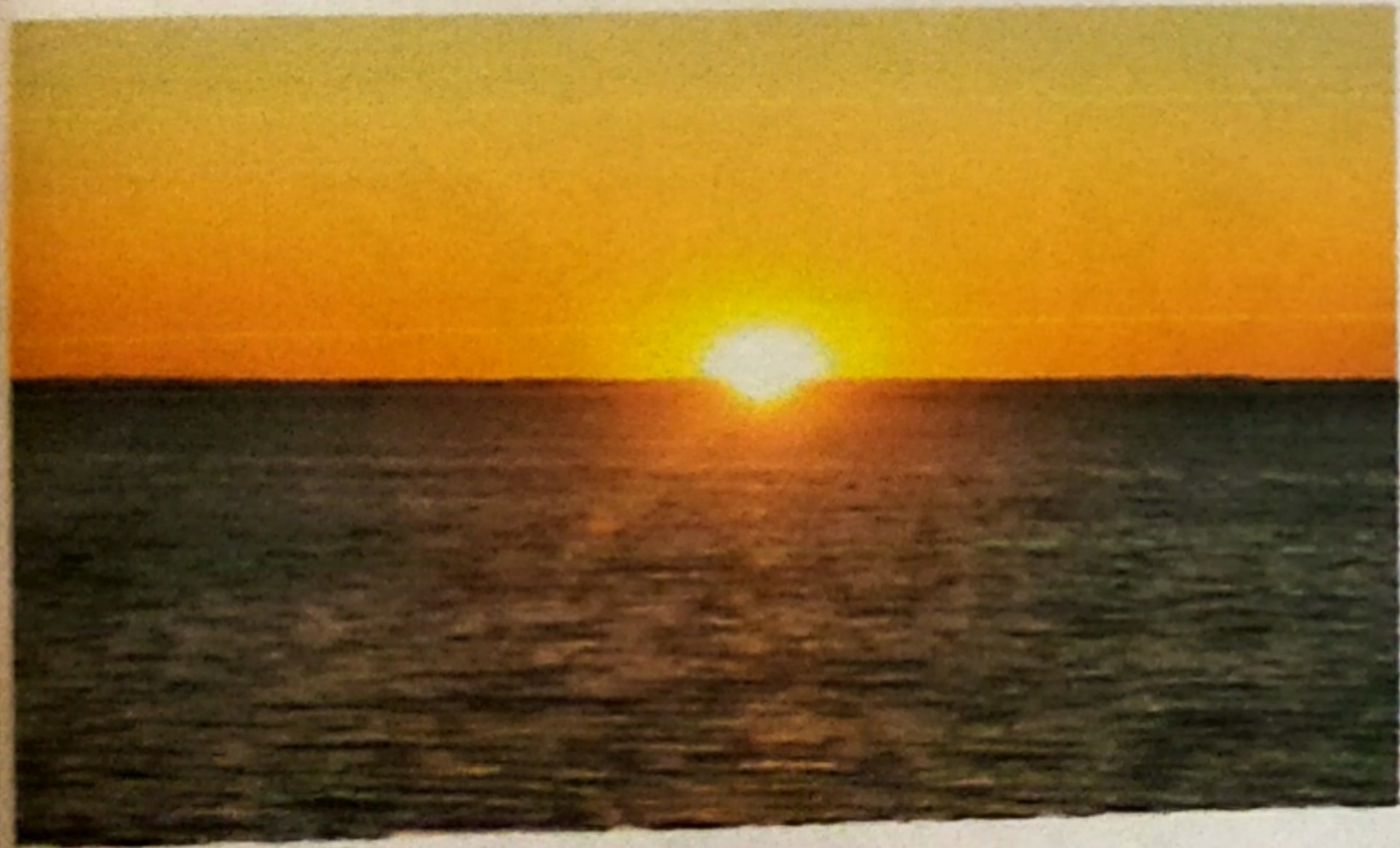
ভোর - সকাল