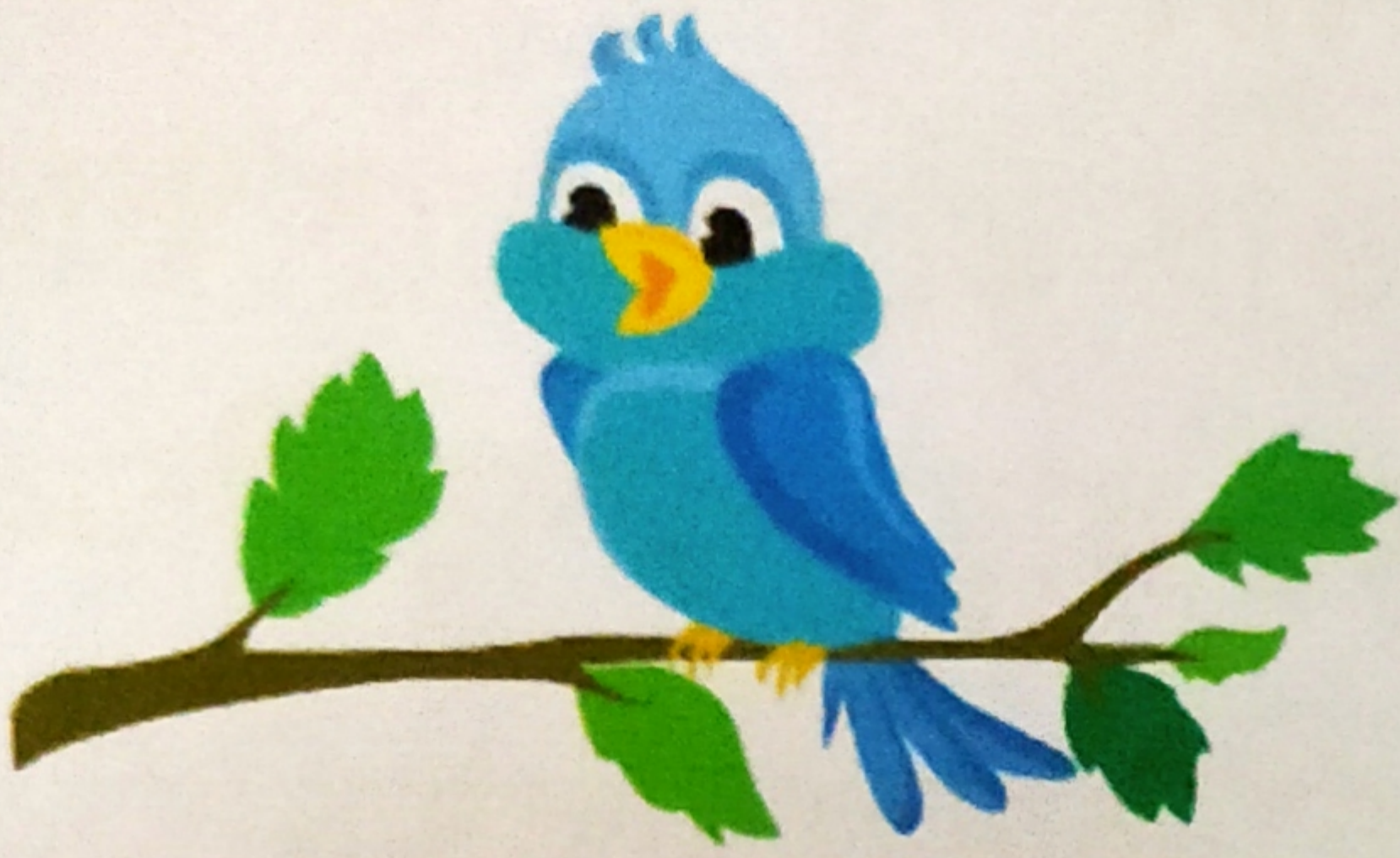
শাখে - ডালে