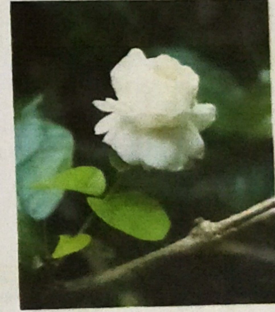
জুঁই-একটি ফুলের নাম