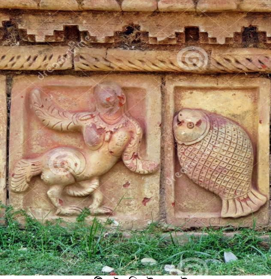
পোড়ামাটির তৈরি টেরাকোটা